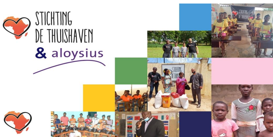
Voorbeeld uit onze presentatie gericht op samenwerking met stichting Aloysius

We hebben een nieuwe presentatie ontwikkelt voor bedrijven en sponsors die open staan voor het leveren van een structurele bijdrage (tenminste 3 jaar) en het aangaan van een partnership.