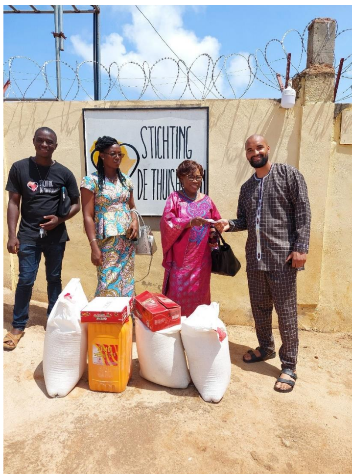
Bezoek van delegatie Victoire Tomegah Dogbe